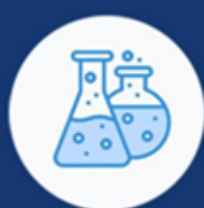
PROIZVODNJA I SNABDEVANJE HEMIKALIJAMA