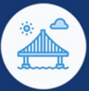
DOBRA OD OPŠTEG INTERESA