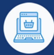
INFORMACIONO DRUŠTVO ELEKTRONSKA TRGOVINA