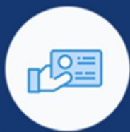
PODACI O LIČNOSTI