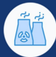
UPRAVLJANJE NUKLEARNIM OBJEKTIMA